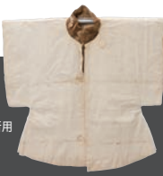
紙衣 2代藩主山内忠義所用