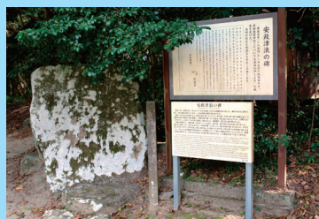
加茂神社・安政津波の碑