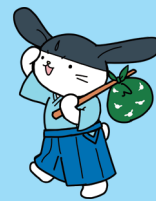
城博キャラクター やまびよん